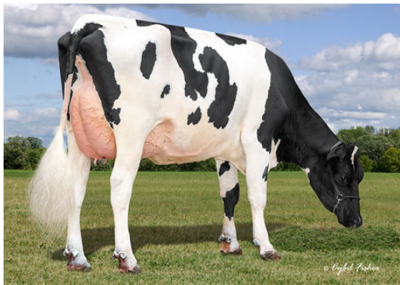
AOT HAWAI HOLLY DAM