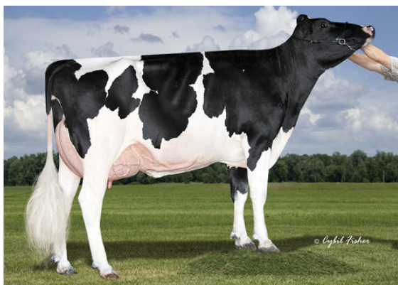
AOT SALVATORE HICCUP GRANDDAM