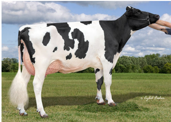
AOT HAWAI HOLLY DAM